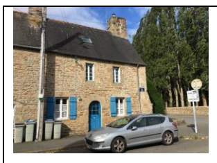
Photo générale de l'immeuble

Date de commande le : 21/08/2020 Repérage effectué le : 21/08/2020 Ce rapport rédigé le 21/08/2020 en 2 originaux comprend 11 pages Il ne peut être reproduit ou utilisé que dans son intégralité.